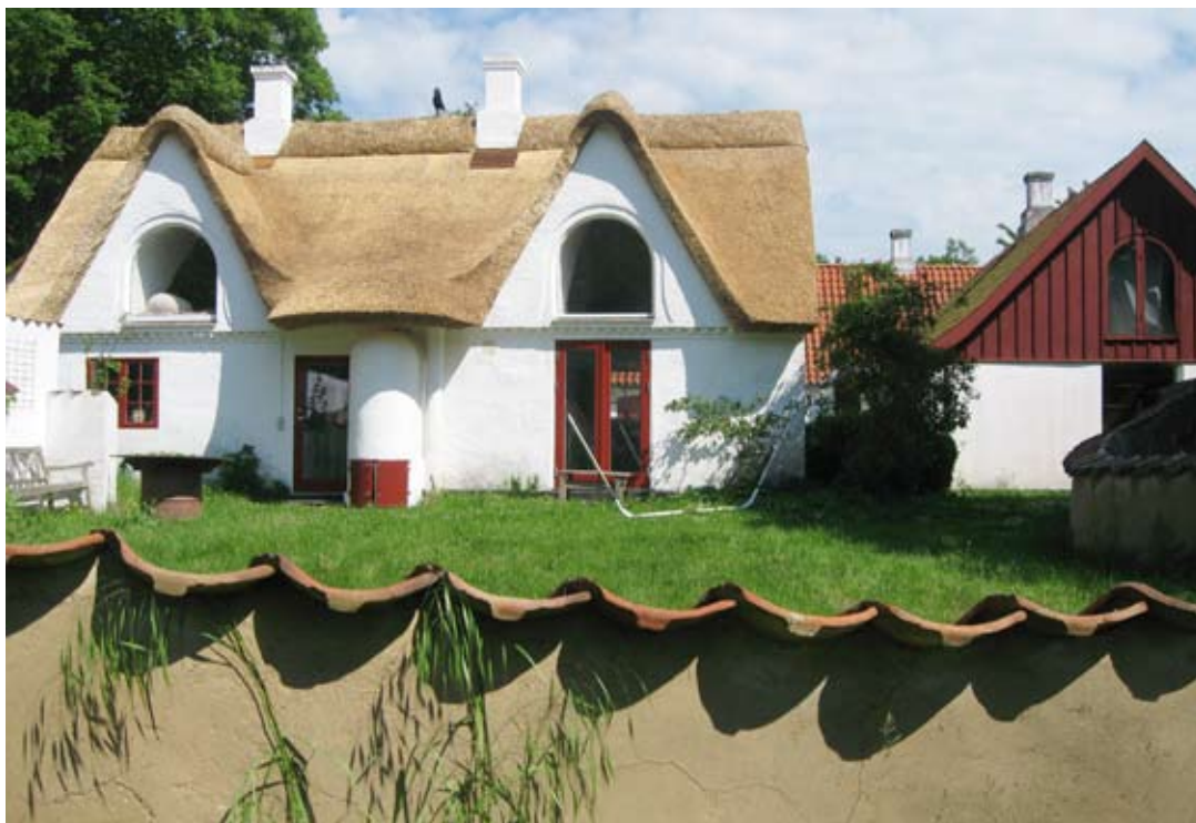
Ombygning af stald, omkranset af lerpudset COB-mur med tagsten som afslutning

Få bekymrede sig om indeklima, afgangning og andet gift fra byggeriets materialer – det gjorde ikke noget, at byggematerialerne er giftige, byggeriet skulle bare gå stærkt !