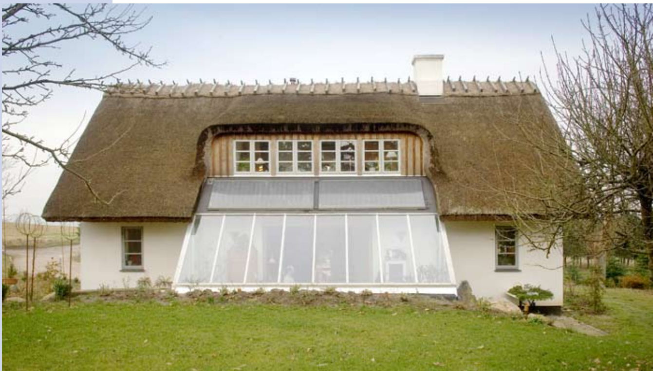
Hus med solrum

Her lidt af de bærende elementer i Fornyet Energis arkitekt- og konsulentarbejde: