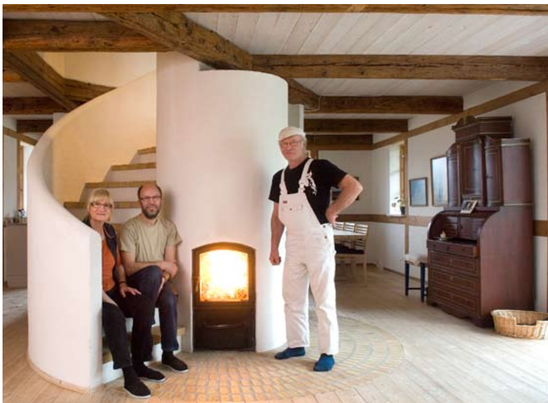
Masseovn med trappe