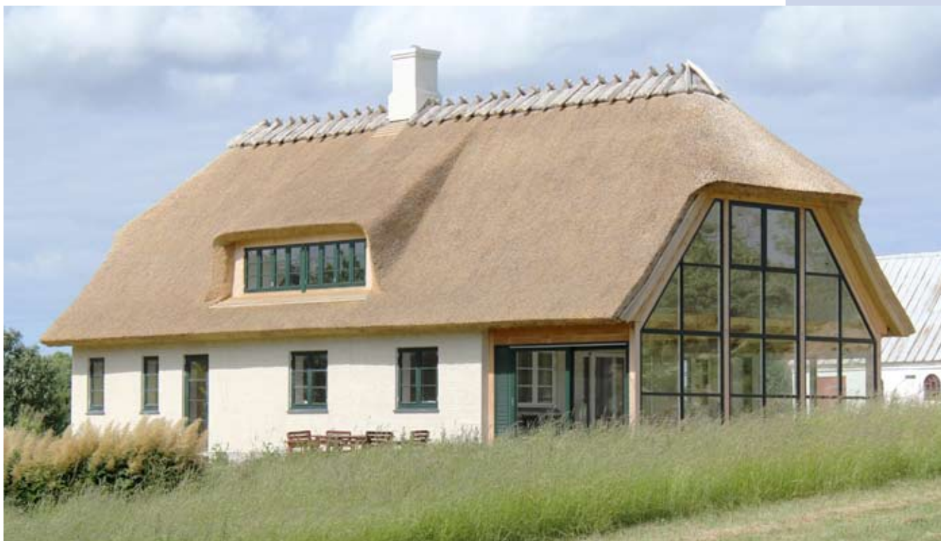
Hus med varmevæg af glas

Vi har samarbejde med mange dygtige håndværkere og har selv ovnsættere.