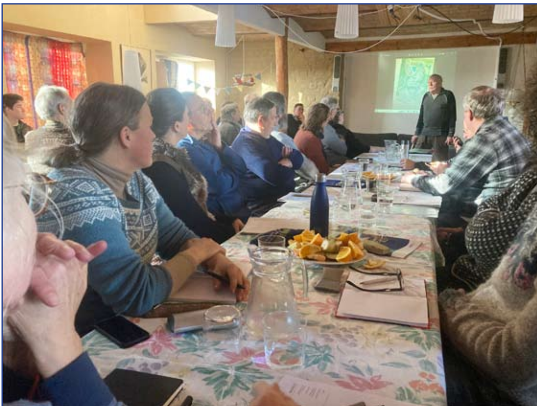
Foto: Workshop i bofællesskabet Baungårds fællesskøkken